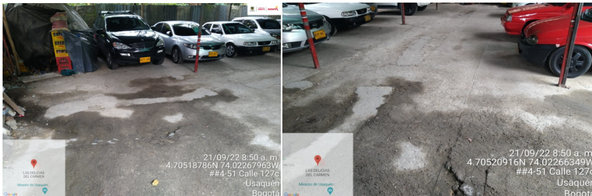
Fotografías No. 3 - 4. Endurecimiento de CER de la Quebrada Trujillo mediante la utilización de mezclas de mortero.