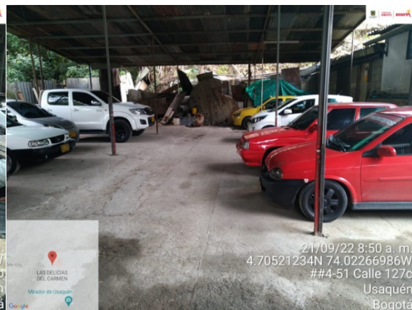
Fotografía No. 1. Establecimiento de ramada como parte de la actividad para el estacionamiento vehicular en el CER de la Quebrada Trujillo.